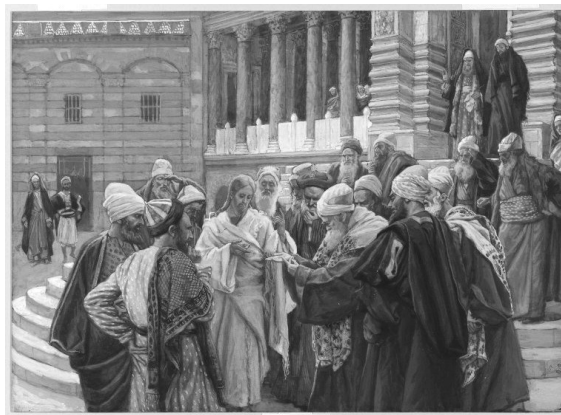
James Tissot: Az adópénz (1890 k.)

❖ Szeretnénk felhívni a kedves hívek figyelmét, hogy a téli időszámítás október 29-én , jövő vasárnap hajnalban kezdődik, az órákat egy órával vissza kell állítani.